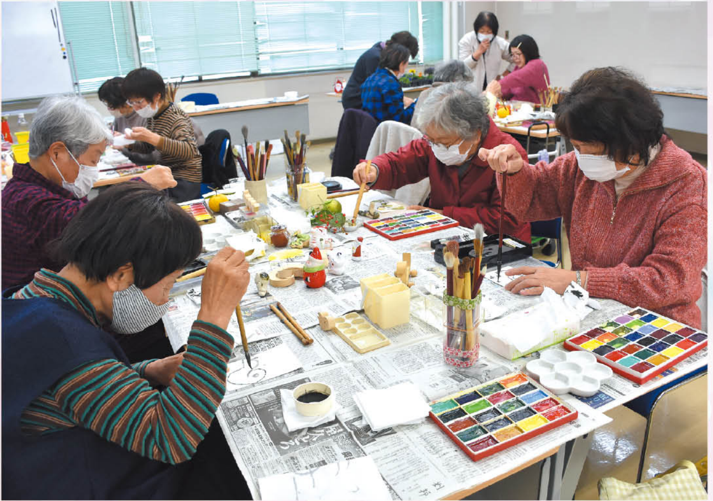
ボランティアスクール「チャレンジ!絵手紙カレンダー」