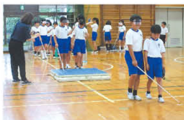
アイマスクガイドヘルプ体験